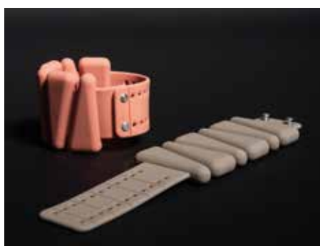
CAVIGLIERE 1 KG COPPIA