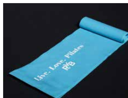
ELASTICO 2 M